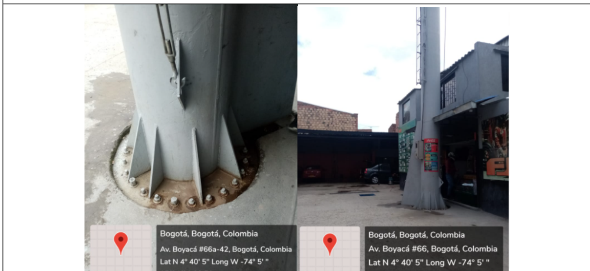
Foto 3 y 4. Detalle del estado de la base y del mástil de la valla