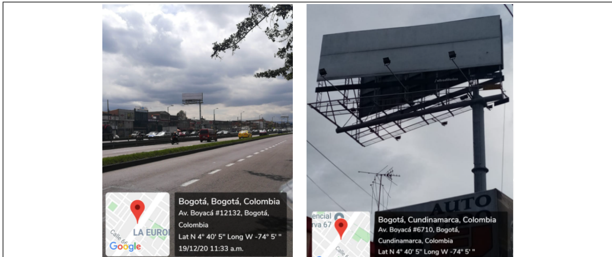
Foto 1 y 2. Vista panorámica del predio y de la estructura de la valla tubular instalada en la Avenida Carrera 72 No. 66 A - 42 (Dirección catastral) orientación Norte - Sur